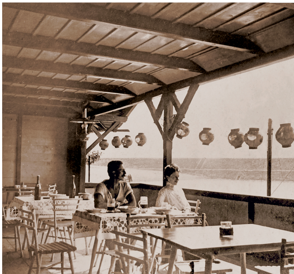
S manželkou na verandě ČYKu, 1912

1933 – 17. ledna vyplul již naposled po vodách řeky Stýx.