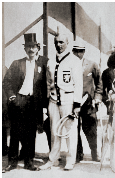
Josef Rössler-Ořovský jako ambasador Českého olympijského výboru spolu s tenistou Žemlou na olympijských hrách ve Stockholmu roku 1912

Živelná láska k přírodě a ke sportu jej provázela celým životem. Nabídl české mládeži sport a kulturu těla jako něco zcela nového v době, kdy národ dával přednost vysedávání a politizování v hospodách a kdy se o výletu do Chuchle mluvilo