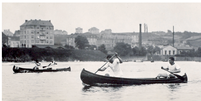
Kánoe na Vltavě