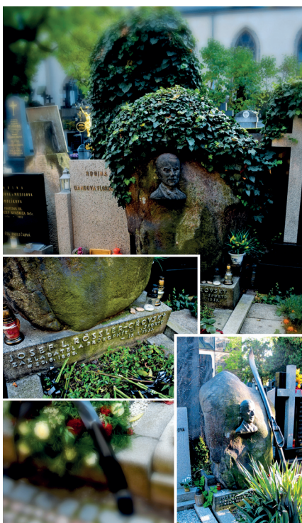
Náhrobek Josefa Rösslera-Ořovského na Vyšehradě