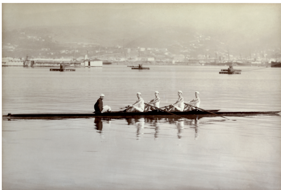
Veslování v Terstu jako trojka (třetí zprava), 1890