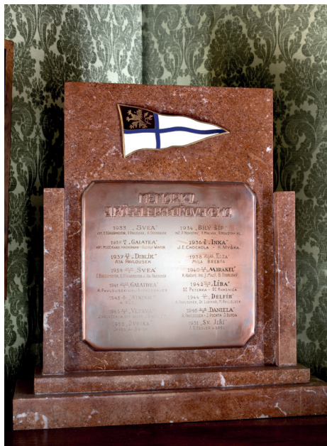
Memoriál Rösslera-Ořovského – putovní plaketa jachtařského závodu, jehož první ročník se jel již v roce 1933.