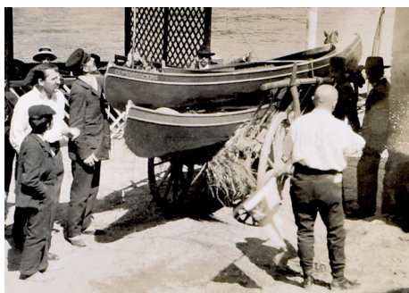
Se svojí COMASSAGEROU, Štěchovice 1920