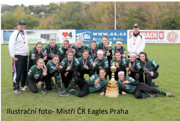
Ilustrační foto- Mistři ČR Eagles Praha

České reprezentantky získaly na domácím ME bronzové medaile.